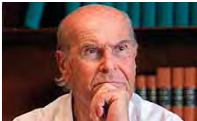
Umberto Veronesi presidente della Fondazione

La Fondazione Veronesi si attiva per diffondere la cultura scientifica